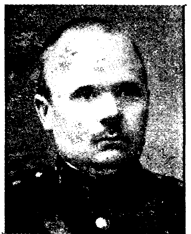
Kindral-major Tõnis Rotberg — sõjaminister.